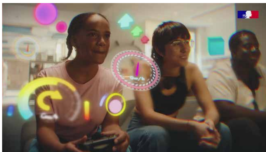
Extrait du clip de campagne

Pour être au plus proche des enjeux et des besoins actuels que traversent les bibliothèques, la campagne a fait l'objet d'une concertation étroite entre les services de l'Etat, centraux et déconcentrés, les associations représentatives des collectivités territoriales et les professionnels de la lecture publique. Cette campagne a été menée en partenariat média avec France Télévisions, France Bleu et Insert.