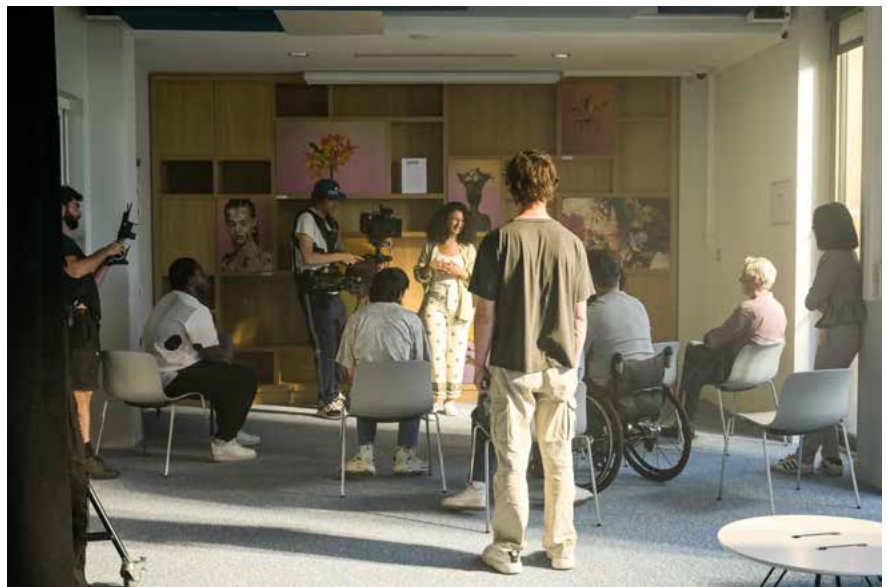
Photo du tournage du clip de campagne

Lumineuse, innovante dans ses services, couvrant 900 m 2 répartis sur trois niveaux, la médiathèque l'Eclipse comporte toutes les spécificités d'une médiathèque moderne : disposant d'une ludothèque pour les plus jeunes, de plusieurs espaces de lecture, de détente et de consultation de documents, la médiathèque l'Eclipse valorise tout particulièrement la culture numérique à travers un espace dédié aux jeux vidéo et par de nombreux ateliers (formation, programmation, de réalisation d'objets par les imprimantes 3D, etc.).