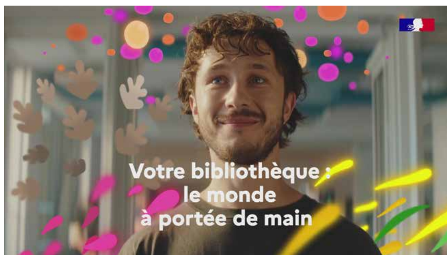
Extrait du clip de campagne

Cette journée des bibliothèques vient en parallèle du lancement de la grande campagne de communication « Ma bibliothèque : le monde à portée de main ».