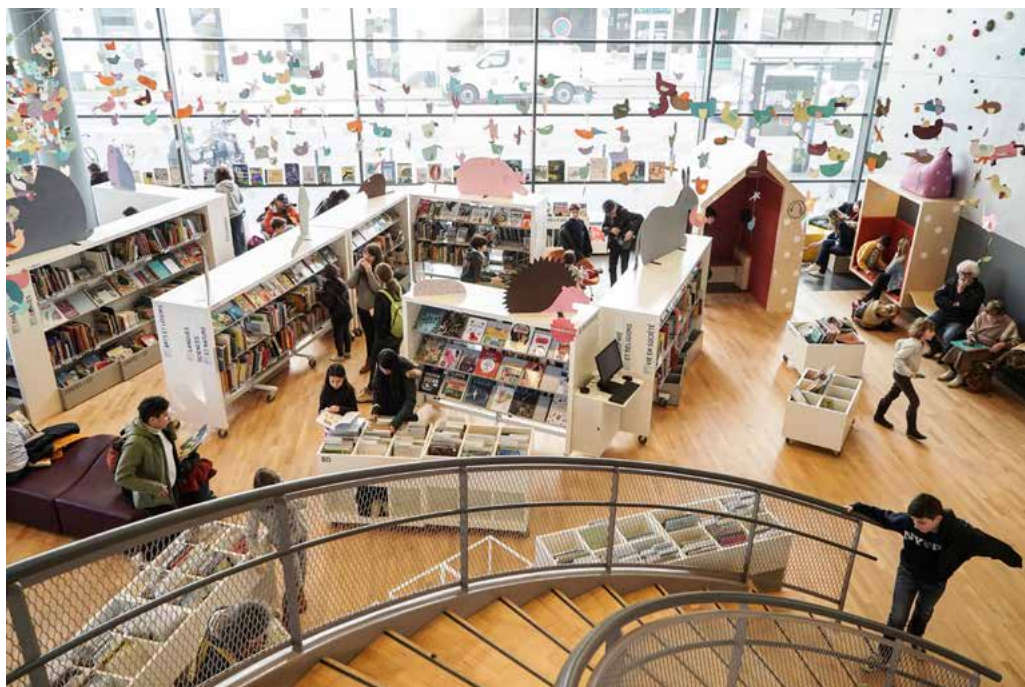
La bibliothèque des Champs Libres à Rennes

Le ministère de la culture a poursuivi la modernisation de ses bibliothèques nationales : achèvement de la rénovation des espaces historiques de la Bibliothèque nationale de France, rue de Richelieu ; lancement de la construction d'un nouveau centre de la BnF à Amiens ; programmation d'une Bibliothèque publique d'information (Bpi) offrant plus de places aux étudiants franciliens, dans un Centre Pompidou rénové en 2030.