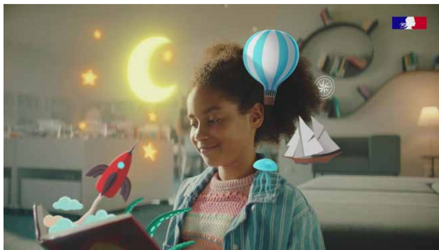
Extrait du clip de campagne

Les bibliothèques se sont ouvertes à tous les contenus culturels et d'information, mêlant savoirs et divertissement, avec des collections et des services de plus en plus numériques. Cette campagne balaye ainsi les clichés persistants et affirme haut et fort que les bibliothèques sont des lieux de vie ouverts à tous, libres d'accès et à proximité de chaque citoyen.