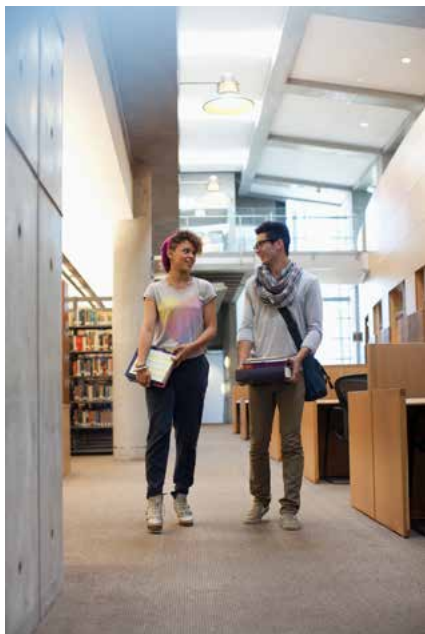
Sam Edwards © Getty Images, 2011